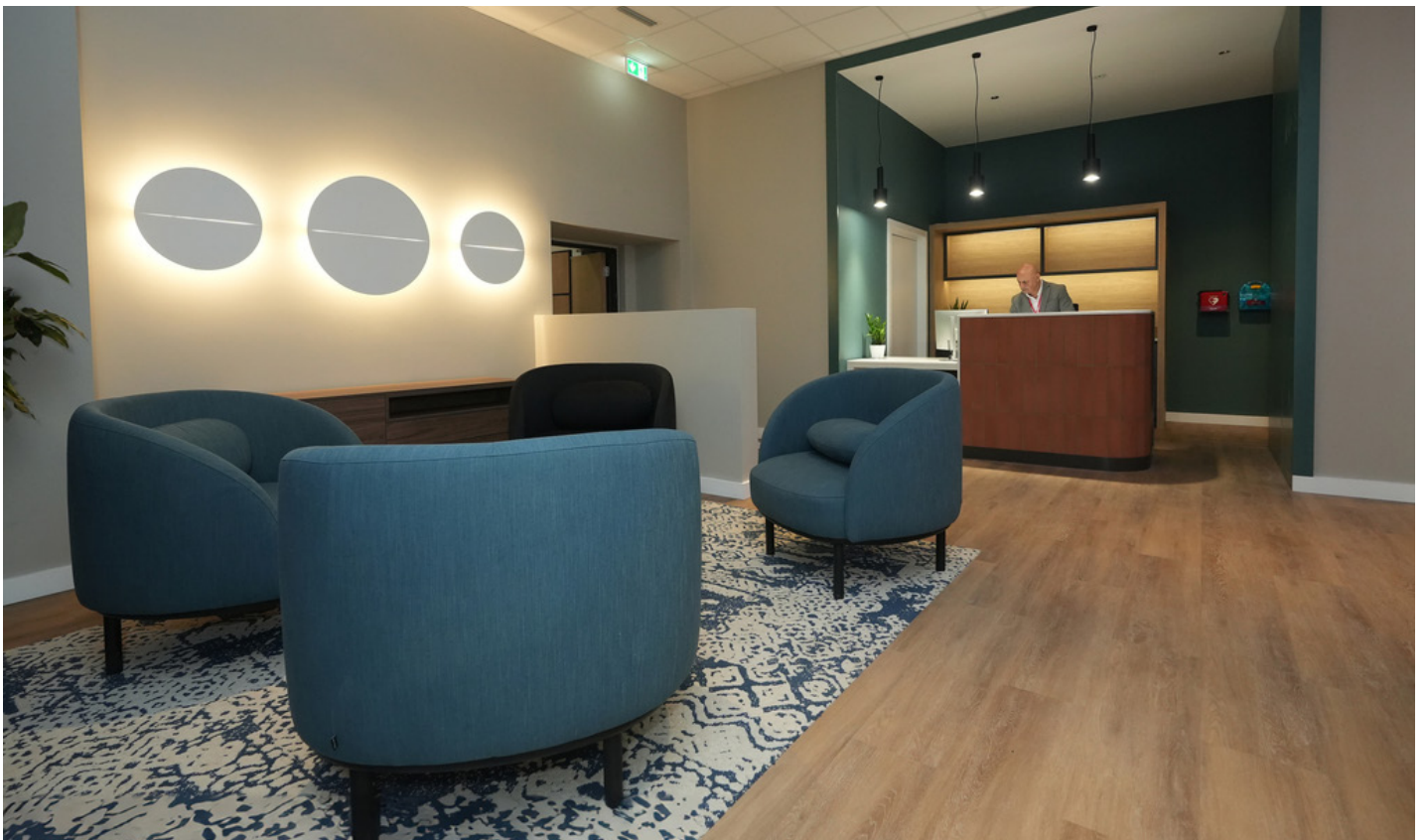
HSBC Hub - ir-Reception għall-Klijenti

It-timijiet tad-DBS huma parti mit-tim usa' tal-HSBC fl-Ewropa, li jjsfruttaw l-għarfien, il-kompetenza u l-appoġġ tal-kollegi tagħna fi 12-il pajjiż. Fis-sajf tal-2023, kollegi mill-IT u t-timijiet tal-Uffiċċju tal-Kap tal-Kontrolli rebhu premijijiet taht żewġ kategoriji differenti, 'Believe in our Vision' u 'Take Pride' in what we do' fiċ-ċerimonja tal-premijijiet ta' DBS Europe.