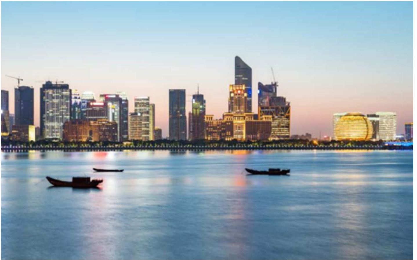
F'Lulju 2023, TradeMalta neda Programm Go Global appoġġjat minn HSBC li jrawwem l-internazzjonalizzazzjoni ta' kumpaniji bbażati f'Malta.

Kif għamilna matul l-2023, se nkomplu niffukaw fuq li nżidu l-valur lill-klijenti tagħna u nagħtuhom aċċess għal dak kollu li l-Grupp HSBC għandu x'joffri. Dan nistgħu nagħmluh biss bis-saħħa tar-Relationship Managers dedikati u professjonali tagħna u membri oħra tat-tim, li huma impenjati li jgħinu lill-klijenti tagħhom jindirizzaw l-isfidi u jmxexxu n-negozji tagħhom 'il quddiem. Aħna se nkomplu nipprovdu lit-timijiet tagħna l-għodda meħtieġa u taħriġ kontinwu biex ikunu jistgħu jifhmu l-ħtiġijiet tal-klijenti u jibqgħu infurmati dwar kwistjonijiet li għandhom impatt fuq l-ambjent tan-negozju li dejjem jinbidel.