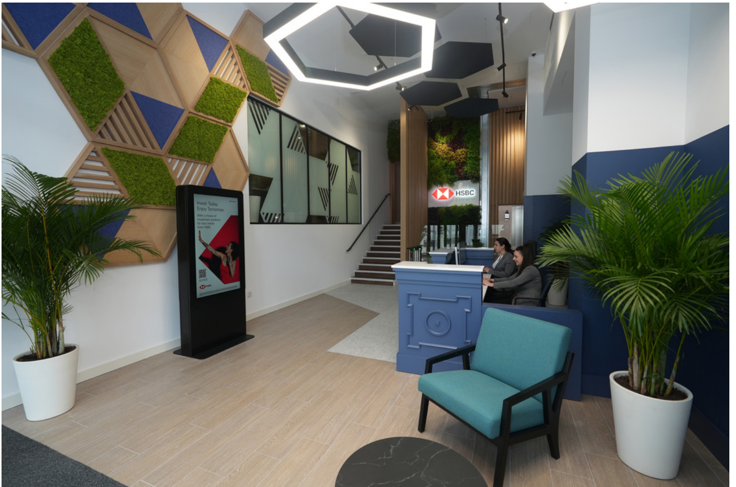
HSBC Hub – ir-Reception Prinċipali