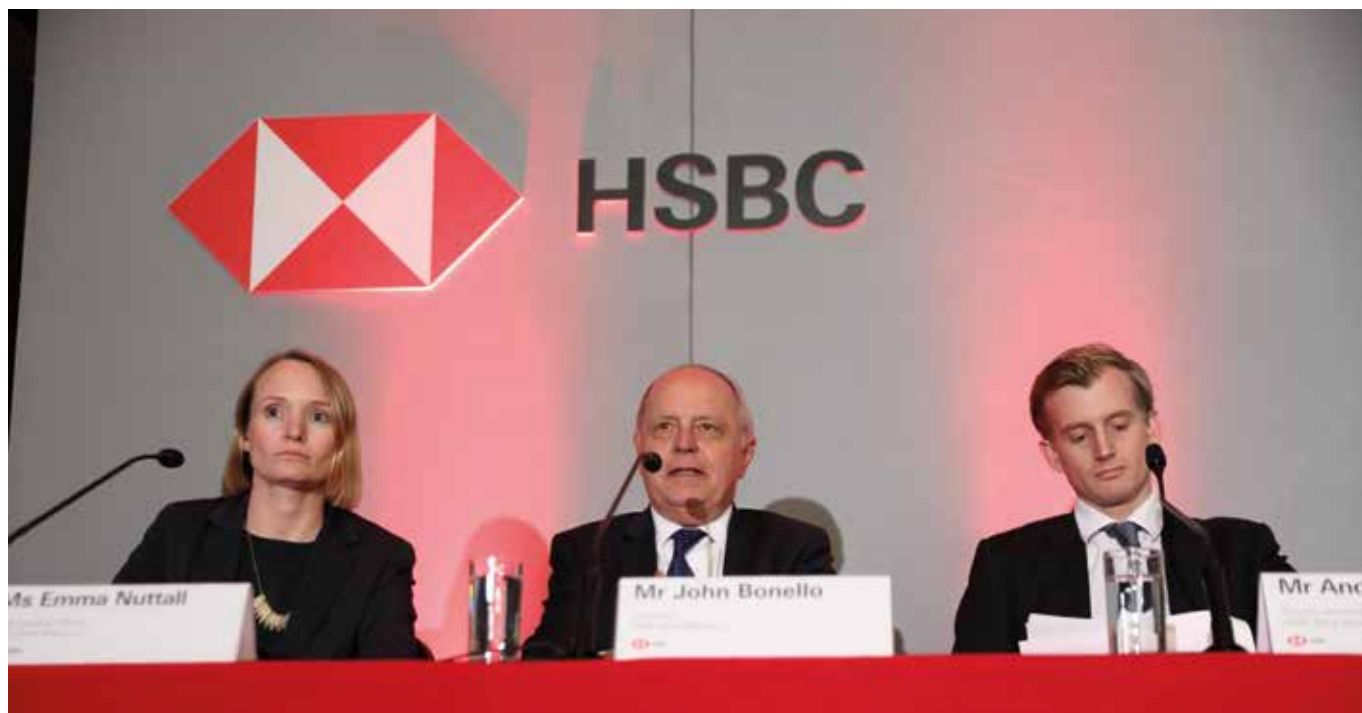
Riżultati Finanzjarji ta' Tmiem is-Sena, 18 ta' Frar 2020, Kamra tal-Kummerċ, l-Intrapriża u l-Industrija