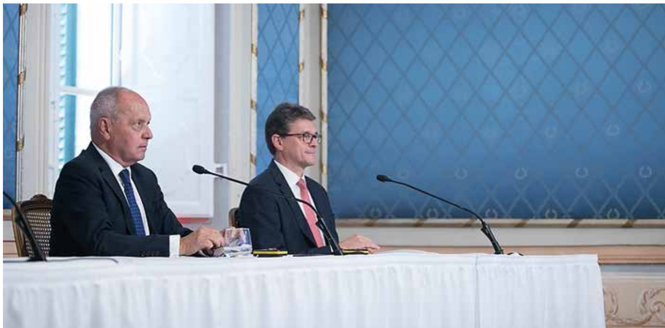
Riżultati Finanzjarji ta' Nofs is-Sena, 3 ta' Awwissu, b'kollegament remot

Il-Programm ta' Tibdil Regolatorju tal-bank mexxa 'l quddiem fuq diversi regolamenti godda u imġedda dwar il-ħarsien tal-investituri u l-konsumaturi, b'hal pereżempju t-tieni Regolament dwar Hlasijiet Transkonfinali ('CBPR II'), it-tieni Direttiva dwar is-Servizzi ta' Pagament ('PSD II'), u t-tieni Direttiva dwar id-Drittijiet tal-Azzjonisti ('SRD II'). Dawn ir-regolamenti għandhom l-għan li jiffaċilitaw l-espansjoni tal-impronta diġitali u l-inkluzjoni finanzjarja fil-prodotti u s-servizzi bankarji, waqt li tiġi żvelata informazzjoni aktar kompleta lill-klijenti u lill-azzjonisti. Barra minn hekk, fid-dawl tal-Covid-19, il-Bank Ċentrali ta' Malta implimenta wkoll id-Direttiva dwar Moratorji fuq Faċilitajiet ta' Kreditu f'Ċirkustanzi Eċċezzjonali (Direttiva tal-Bank Ċentrali Nru 18). Din id-direttiva għandha l-għan li ttipprovdi qafas regolatorju għall-istituzzjonijiet ta' kreditu u finanzjarji f'Malta biex jagħtu moratorju fuq faċilitajiet ta' kreditu lil min issellef u ġie milqut materjalment mill-imxija tal-Covid-19.