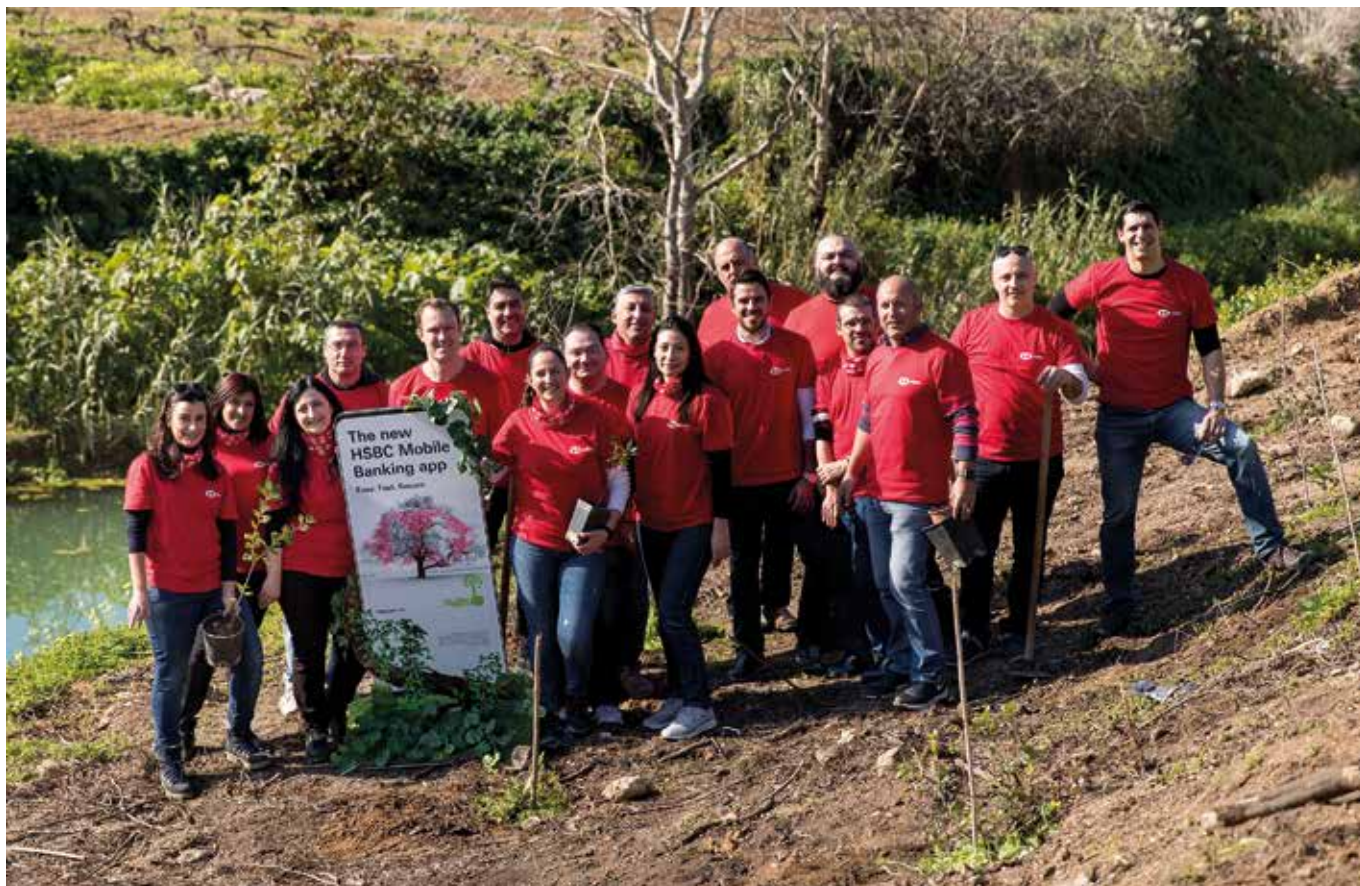
Impjegati tal-HSBC Malta f'attività ta' thawwil ta' sigar

L-HSBC Centre of Sustainable Finance isostni lill-HSBC fl-ambizzjoni tiegħu biex iħaffef it-tranzizzjoni għal livelli aktar baxxi ta' karbonju billi jhegġgħna naħsbu iżjed dwar kif nittrasformaw l-ekonomija reali u nsaħħu r-rispons tas-sistema finanzjarja għall-bidla fil-klima. Fl-2020 l-HSBC Foundation bdiet taħditiet ma' diversi istituzzjonijiet biex jifasslu programmi marbutin mal-Climate Ambition tagħna, li se jiġu varati fl-2021.