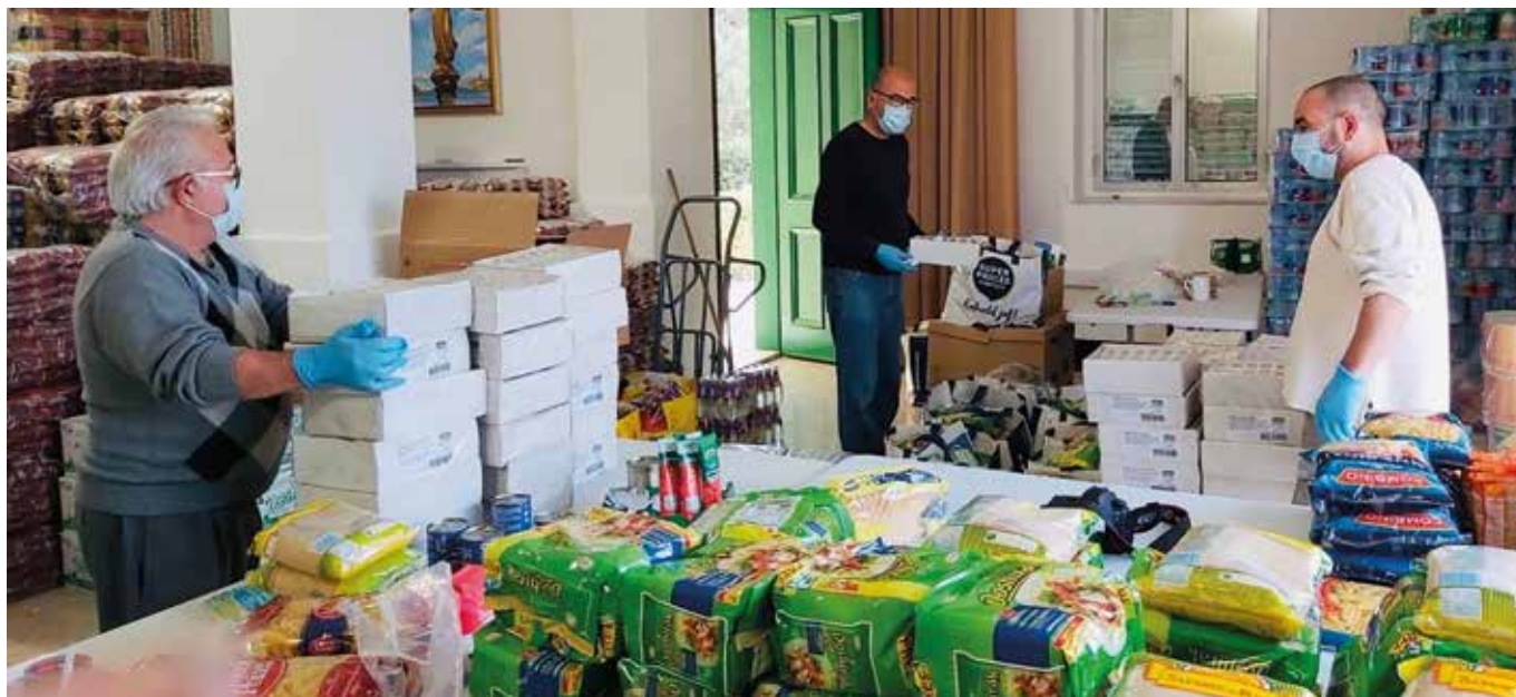
L-HSBC Malta jaghti l-appoġġ fil-proġett tat-tqassim tal-ikel tal-Malta Trust Foundation